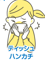
ティッシュ ハンカチ